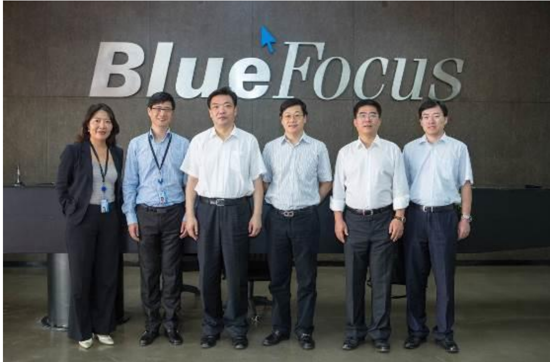
北京市政协主席吉林与市文资办主任周茂非到蓝色光标调研

自蓝色光标公司总部迁入恒通国际创新园新址后，北京市政协主席吉林、北京市文资办主任周茂非、中关村管委会主任郭洪等领导先后来公司进行考察和调研，充分肯定了蓝色光标传播集团取得的成绩。中央电视台新闻频道“中国梦”栏目组多次来公司采访拍摄，有关系列报道已在央视播出。