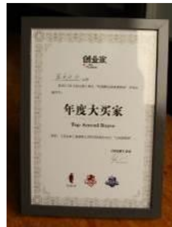
《创业家》年度大买家