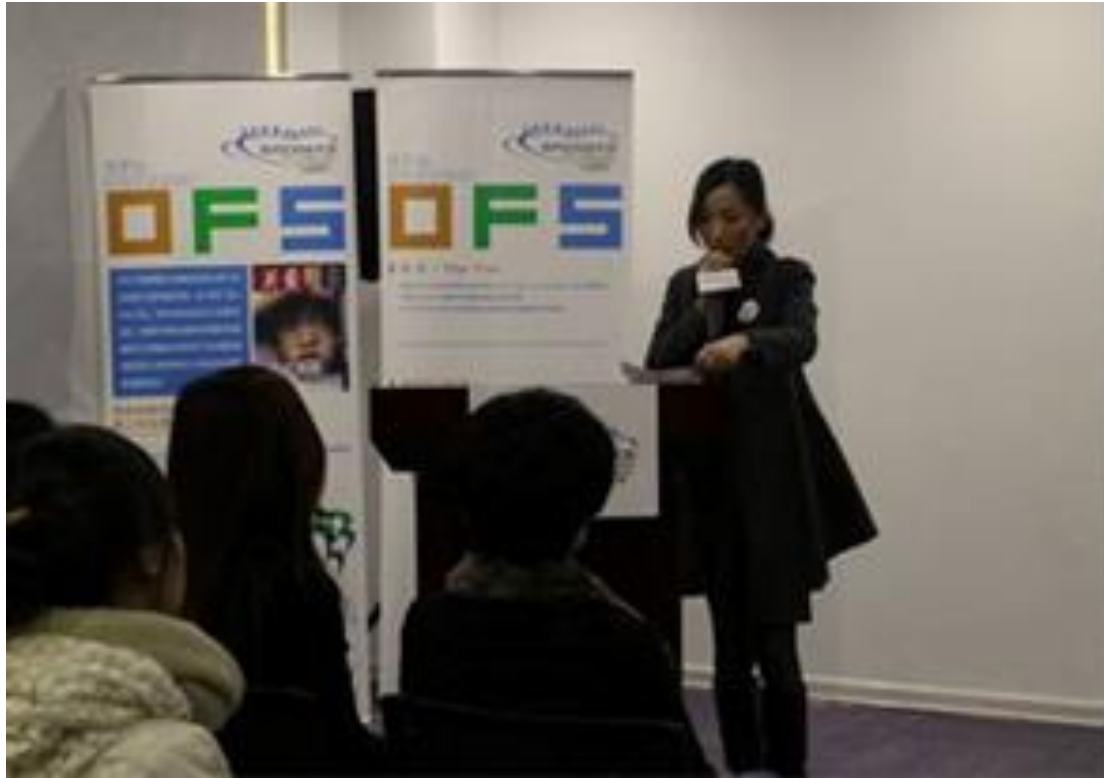
蓝色光标参加 OFS 组织的活动并发言