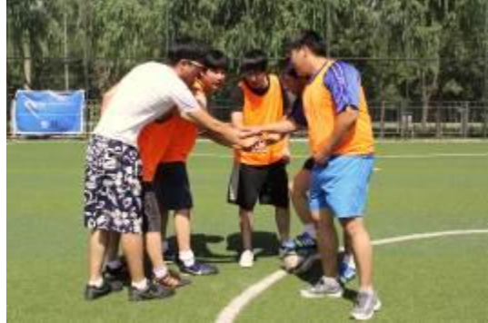
蓝标运动会足球赛