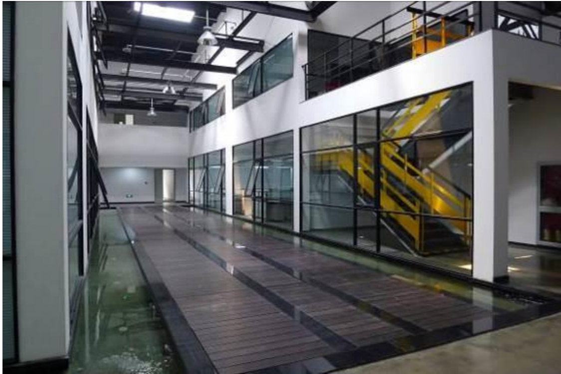
办公楼内公共区域