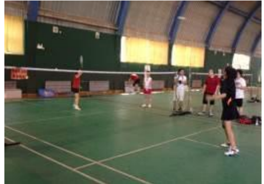
蓝标运动会游泳赛和羽毛球赛