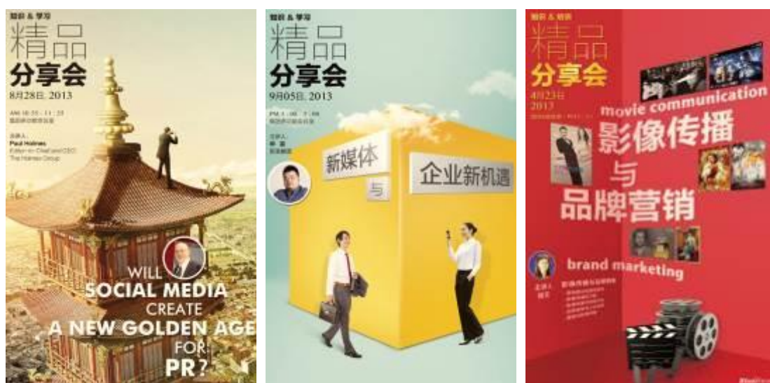
公司精品分享会部分海报

2013年全年蓝色光标北京公司总计举办7场培训会，到场人数共计364人次，覆盖高级客户主任、客户经理和业务主管三个层级，详见下表：