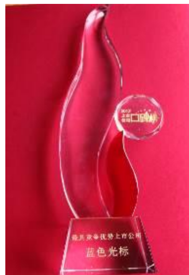
2013 中国上市公司口碑榜最具竞争优势上市公司