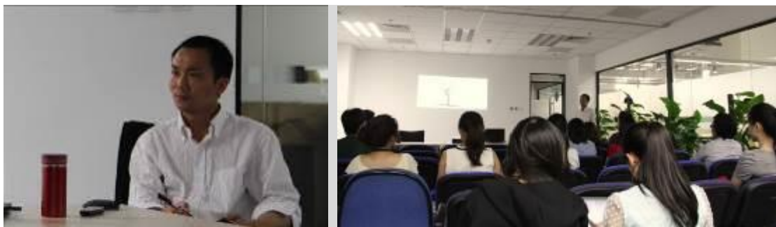
我们的自由天空（OFS）分享会现场