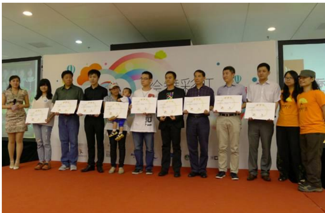
蓝色光标资助和参与麦田教育基金组织的公益活动并接受颁奖