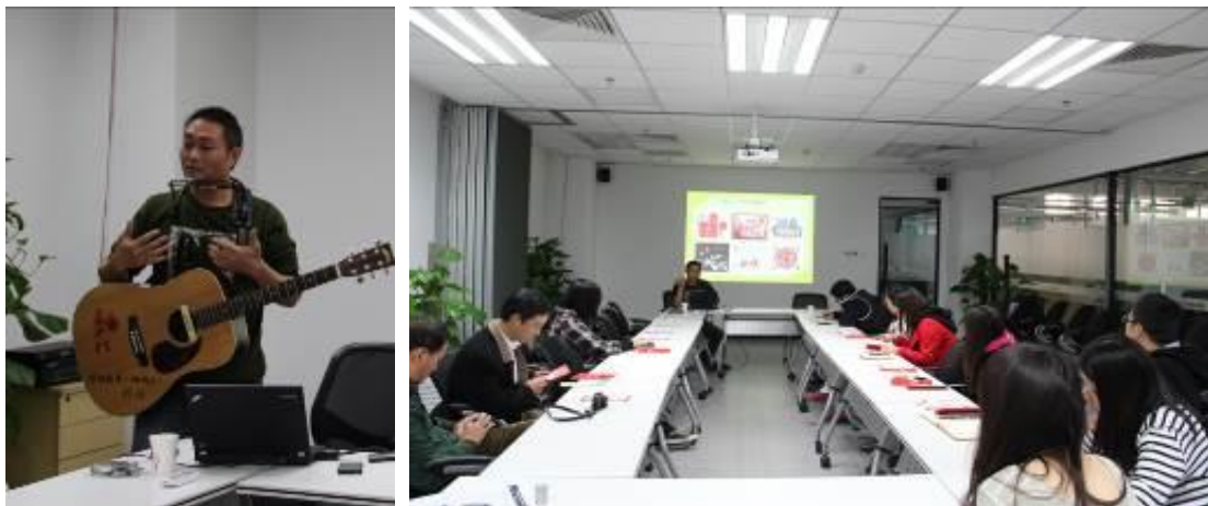
北京工友之家分享会现场

2013年4月四川雅安地震牵动全国人民的心，在各地同胞为四川灾区的群众祈福的同时，也有众多企业捐款捐物。蓝色光标也从各个方面展开行动和思考：我们自己能做些什么？我们又该如何回答来自客户的诸多“CSR策略制定”的问题，帮助客户制定一个好的应对方法？为此蓝色光标北京地区公司和广州地区公司分别举办了两场培训会，邀请公司在相关方面具备丰富资源和经验的资深人士从现状分析、应对建议、过往经验、可用资源、网络舆情特点、案例分享等方面与大家一起讨论灾情时期的公关应对和注意事项。力争让项目组人员在较短时间内，快速地了解此事相关的多方面信息，并帮助客户迅速做出决策和部署。