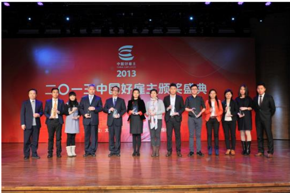
蓝色光标荣获 2013 “中国好雇主”称号

蓝色光标 2013 年获得了“中国好雇主”称号。这一奖项是外界对蓝色光标坚持员工第一的核心价值观的认同，也激励公司继续努力，帮助员工在工作和事业中获得成长，吸引更多优秀人才。