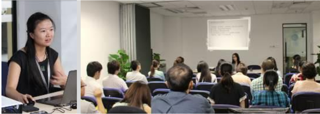
麦田“舞计划”分享会现场