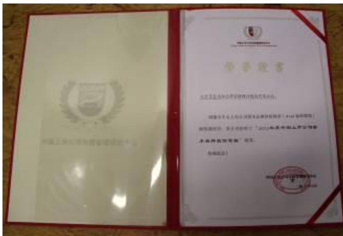
2013 年度中国上市公司资本品牌溢价百强