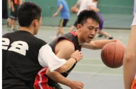
蓝标运动会篮球赛