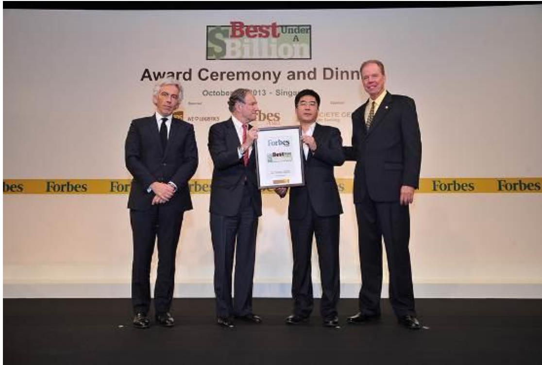
公司荣获福布斯最具成长性公司大奖